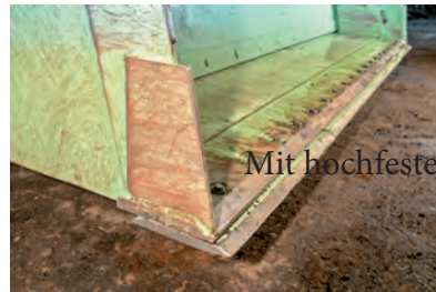
Mit hochfester- und geschraubter Schürfleiste

Die Standard- Rotorscheufel ist für den Volvo-Schnellwechsler TPZ (VAB-TPZ) ausgelegt, aber auch alle anderen Radladeraufnahmen können problemlos angeboten werden